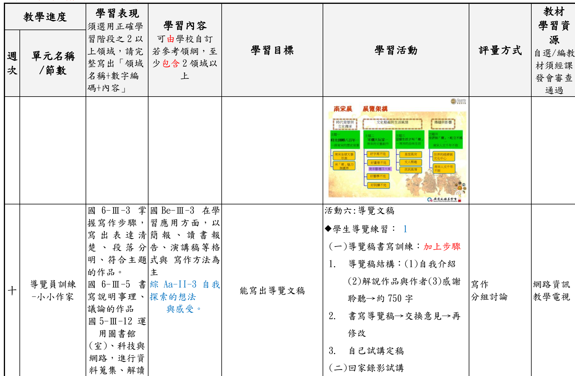
附件 3-3 (九年一貫/十二年國教併用)