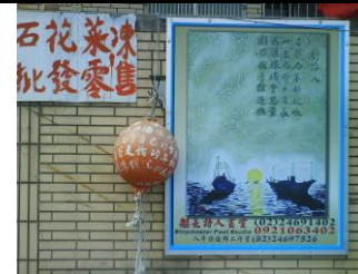
展示在林福蔭船長家門口的作品