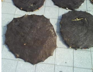
長潭里潮間帶、海蝕平臺 晒髮菜