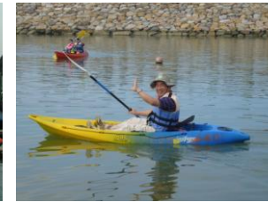
↑海域休閒活動：乘坐風帆、划獨木舟